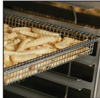
炸篮 325 x 530mm BS-26730