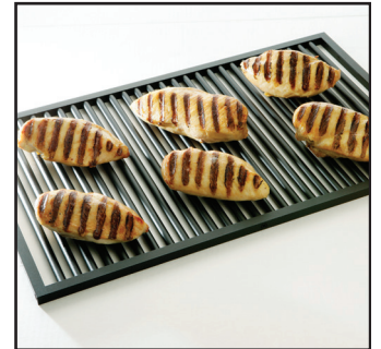
烧烤格栅 325 x 530mm SH-26731