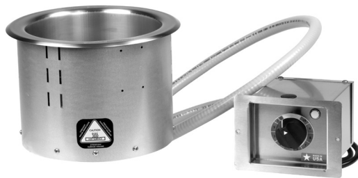
700-RW (Bac insérable non fourni)