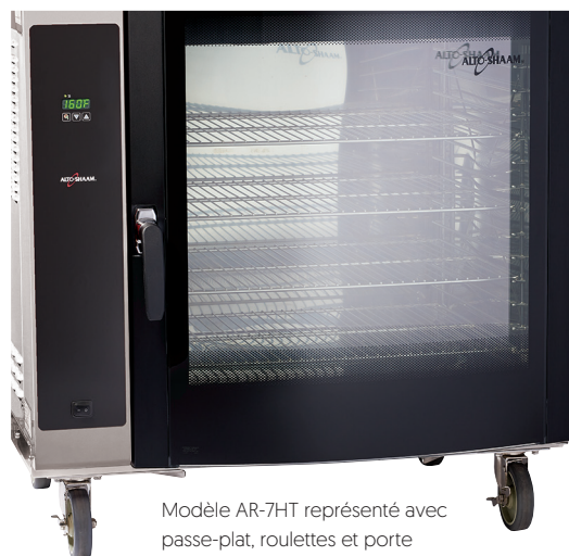
Modèle AR-7HT représenté avec passe-plat, roulettes et porte vitrée incurvée